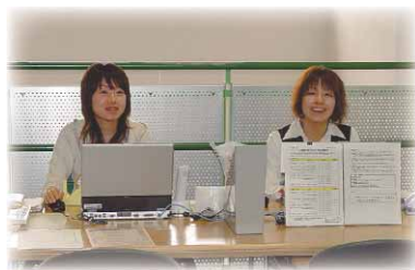
わたしたちが質問にお答えします

いわき市ITサポートセンターは、いわき市民のIT基礎技能習得を支援する目的で、平成15年6月に生涯学習プラザ内に開設されています。電話によるサポートをはじめ、プラザ研修室におけるIT小レクチャーをおして、パソコン技能の向上や、使いこなす上での疑問やトラブル解決にお応えしてきました。 平成18年度からは、皆様のご要望にきめ細かく対応できるよう、生涯学習プラザ事業としてサービスを提供してまいります。その一つとして、これまで別々にご案内してきたIT小レクチャーの募集要項をプラザだよりに掲載します。プラザ主催IT関連講座と小レクチャーが連携することで、情報活用能力の向上支援だけでなく、生涯学習の一環として市民のIT技能向上の要望にお応えしてまいります。