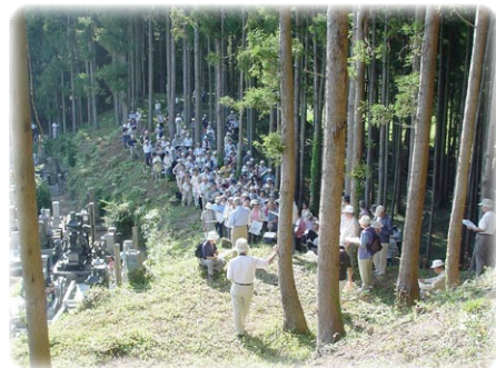
玉山前方後円墳で説明を聞く参加者

生涯学習プラザでは、各講座の放送日に4階の情報交換フロアで放送しています。また、収録したビデオの貸出も行っています。放送日時や講座の詳細な内容は、オープンカレッジのホームページ( http://www.openol.gr.jp/ )をご覧ください。生涯学習プラザ5階窓口までお問い合わせください。 なお、講座のテキストは窓口で無料配布しています。