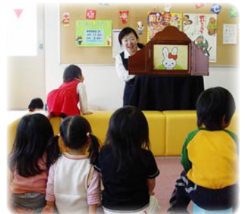
お耳にちょうちょが止まって・・・かわいいうりボンになりました！

プラザでは、「遊びと憩いの広場」を利用して、毎月第4日曜日の午前・午後の2回、2～5才のお子さんと保護者を対象とした、紙しばいの読み聞かせを行います。 1回目の4月24日(日)には、9組21名の親子が集まりました。大きいお兄ちゃんが拍子木をたたいてお手伝い。小さい子も愉快なお話に夢中になり、家族みんなで紙しばいを楽しみました。