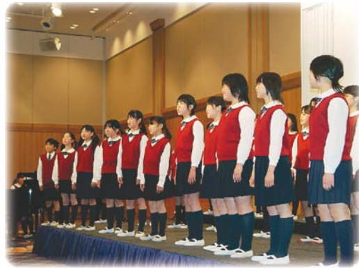
平第三小学校合唱部のみなさん

を得て11部会の実行委員会を組織し、市民の皆様との協働による手づくりのフェスティバルとなりました。