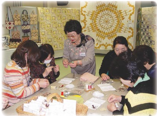
手の込んだキルト作品と製作指導のようす

開催にあたっては、各団体代表のほか、いわき市消費生活センター・国際交流協会・ITサポートセンターの協力