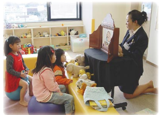
紙芝居に夢中になる子どもたち

じめ、周辺の商店街に多大なご協力をいただき、5000人を超える市民の笑顔が館内に満ちあふれた実りあるイベントになりました。