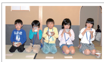
お茶とお菓子でひと休み