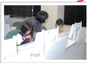
キーボードとにらめっこ