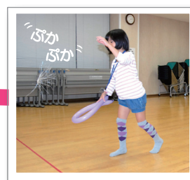
静電気でクラゲが宙に！