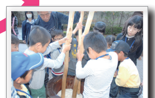
みんなでおもちゃをべったんべったん

いわき市内の小学生20人が4チームに分かれ、プラザの施設ごとの特色に合わせた様々な体験をしました。この日初めて顔を合わせた子どもたちが、力を合わせて課題にチャレンジしていました。