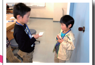
名刺交換ゲームで自己紹介