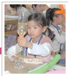
ペットボトルの中でうずがぐるぐる