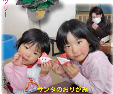
サンタのおりがみ

11月のテーマはクリスマス飾り。9組25名の親子が、クリスマスツリーをつくりました。 サンタのおりがみでクリスマス気分が盛り上がり、たところ、プラザ特製ベーパークラフ