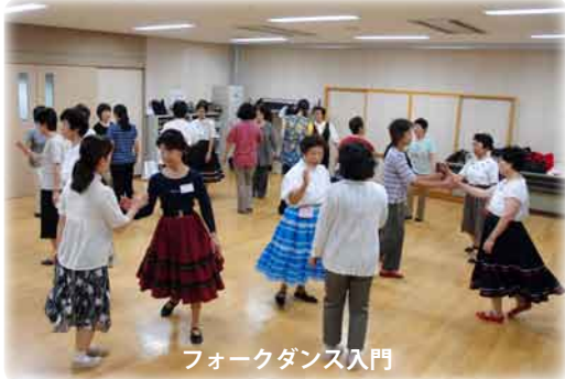
フォークダンス入門

多くの受講者があり、大きな期待を持って臨んだ。受講者も楽しく参加できた。(すずかけフォークダンスサークル) ・熱意のある受講者の姿勢に感動した。(水墨院) 思い通りに行かなかつた事もある反面、受講者