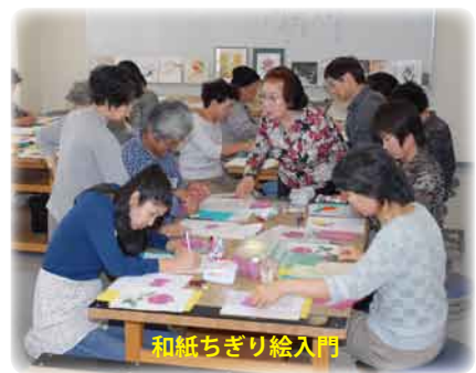
和紙ちぎり絵入門

実際に講座を受講してみても、その体験は受講者には、どのように映ったのでしょうか。 ・親切な指導で楽しい時間を過ごせた。(陶芸) ・焼き上がりがとても楽しみ。(陶芸入門)