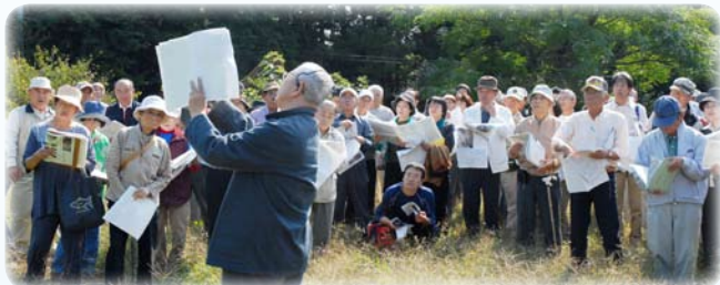
小浜代遺跡の説明を受ける受講生

〒970-8026 いわき市平字一町目1番地 ティーワンビル TEL 0246-37-8888 FAX 0246-22-5555 メール info@isgp.jp