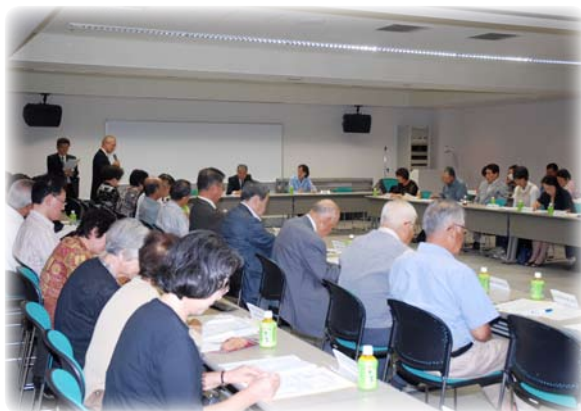
利用者懇談会での質疑応答の様子

ついては、教育委員会と協議・検討のうえ、プラザの利用環境の向上に努めていきます。 なお、第6回生涯学習フェ