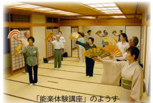
「能楽体験講座」の様子

「能楽入門」は、いわき観世流連合会のみなさんが担当。15名の受講者で2回実施しました。演目は「鶴亀」で、能のうたいである謡曲や略式の演奏・舞である仕舞などを体験しました。扇子を持った手の動きと足の運びを苦労しながらも、受講者はサークルのみなさんといっしょに古典芸能を楽しみました。