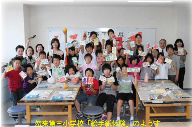
勿来第三小学校「絵手紙体験」の様子

6月2日(火)の午前中、勿来第三小学校学校の5・6年生40名と引率の先生3名が春の見学学習としてプラザを訪れ、2サークルによる体験企画に参加しました。5年生は絵手紙を体験。担当サークルはあす実会です。子供たちは、持ち寄ったさまざまなモチーフ(画題)をハガキいっぱい生き生きと描いていました。6年生は能楽を体験。担当サークルはいわき観世流連合会のみなさんです。畳に座りおなかから声