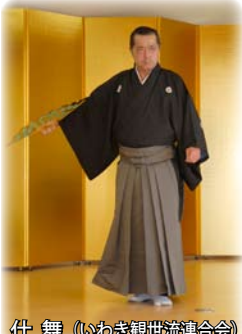
仕舞 (いわき観世流連合会)

〒970-8026 いわき市平字一丁目1番地 ティーワンビル TEL 0246-37-8888 FAX 0246-22-5555 メール info@isgp.jp