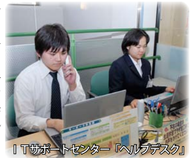
ITサポートセンター「ヘルプデスク」

昨年年度は1455件の相談が寄せられました。利用者の年齢は、50歳以上の方が大半ですが、プラザを利