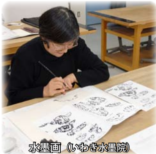
水墨画 (いわき水墨院)

好評のITボランティアリーダー企画パソコン講座を毎月1回開催します。ITリーダー養成講座受講者で結成されたITサポート会「ヘルプデスク」を開いています。「パソコンが突然動かなくなった」、「ワンドリック詐欺の請求画面が消えなくなった」などのトラブルや、