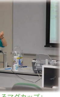
「親子でつくるマグカップ」

今年度の「ITリーダー養成講座」受講生による企画講座です。9名の受講者が2つの班に分かれて、企画立案から進行まで、何度も模擬演習を体験しながら、講座開講までこぎ着けました。 「マグカップ」講座では、マグカップや保存容器など、身近な食器類を写真やイラストで飾り、