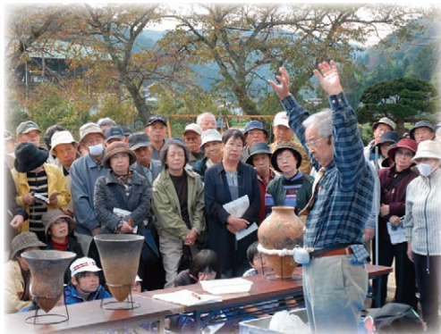
竹之内遺跡の説明を受ける受講者（沢渡小学校）

学習プラザを会場に開講されました。 講座は、平安末期の混乱の時代を迎え、極楽往生を願ういわきの人々の姿を国宝白水阿弥陀堂や県指定重要文化財の上ノ原経塚出土