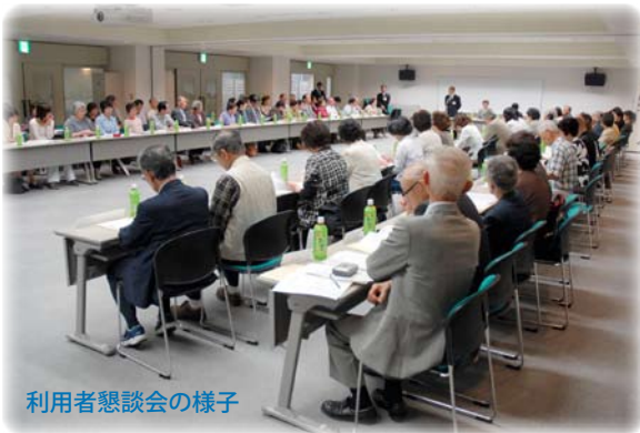
利用者懇談会の様子

(15)が福島県内で開催されます。これに合わせ、2月に開催している生涯学習フェスティバルを、この期間に同時開催することになりました。プラザのフェスティバル