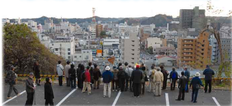
平城跡から旧城下町を見る