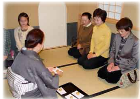
「ふだん着のお茶会」菓子のもてなし

当日は、絶好の秋晴れの下、子どもからお年寄りまで、約100名の市民の皆さまがお茶室を訪れました。プラザで学習している高校生もちょっと一休み、“ふだん着”で本格的なお茶に親しみ、ひとときの安らぎを味わっていました。